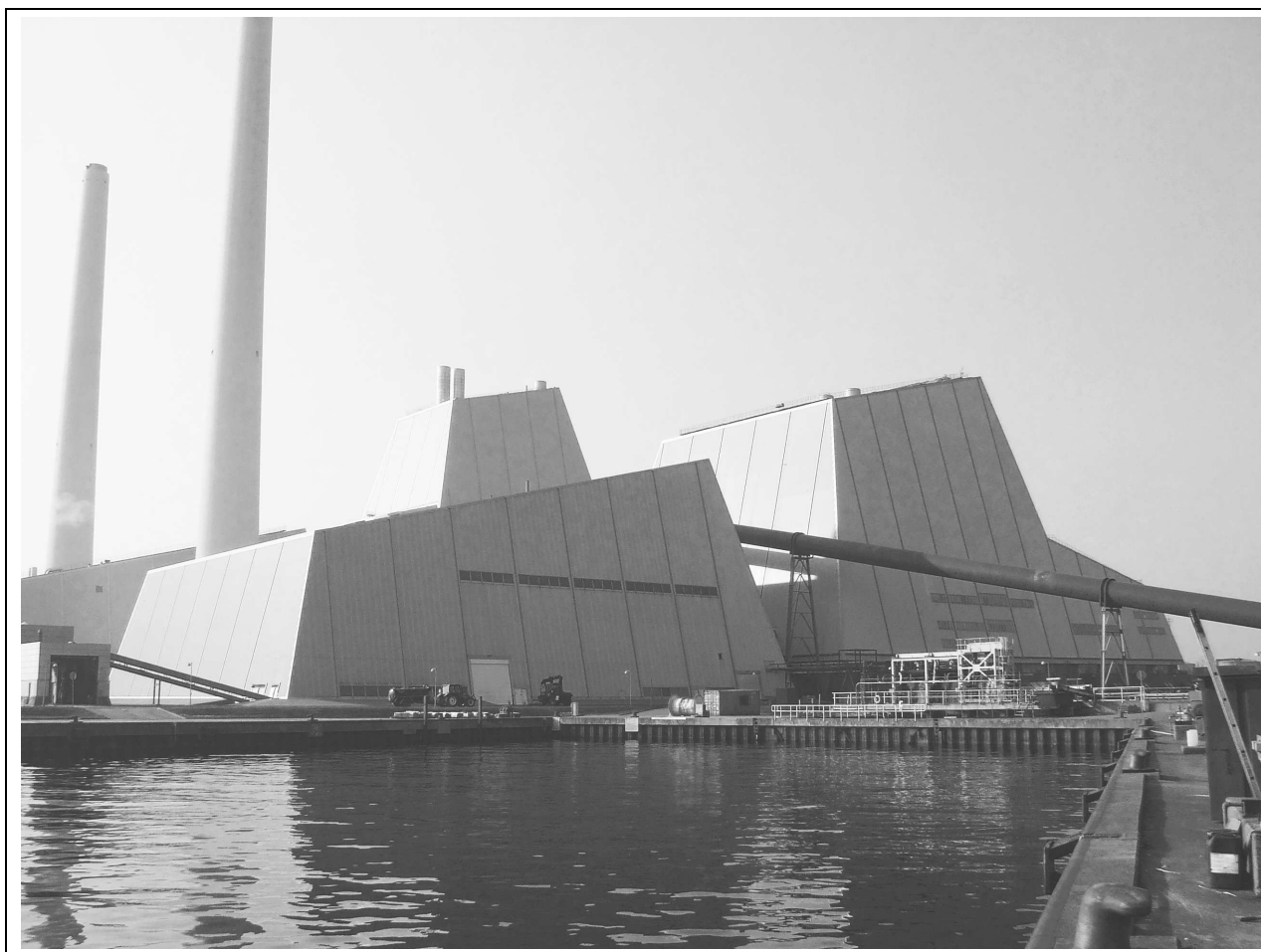
Hier ein Blick auf das Kraftwerk der Firma Dong in Avedøre. Das Lubminer Exemplar würde doppelt so groß. Nach optischen Gestaltungsvarianten, die Gäste und Bürger ansprechen, wird derzeit fieberhaft gesucht.

Einzigster Nachteil: Dieses Kraftwerk braucht keinen Hafen! Und was wird dann aus dem?