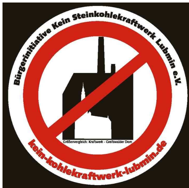
Das Wappen der Usedomer BI „Kein Steinkohlekraftwerk Lubmin“ lässt keine Zweideutigkeiten aufkommen. Im Inneren des „Verbotsschildes“ sehen Sie einen Größenvergleich zwischen dem geplanten Kraftwerk und dem Greifswalder Dom.

Auf dem Parteitag der SPD MV im April 2007 in Salem war das Lubminer Steinkohlekraftwerk ein echtes Konfliktthema. Usedomer Genossen brachten einen Antrag ein, in dem der Kraftwerksbau abgelehnt wird. Der Riss geht so tief, dass die OZ vom 7.5.07 das Thema mit dem Titel „Neues Kohlekraftwerk spaltet Koalition“ behandelte.